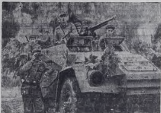
Отряды Патриотических вооруженных сил Лаоса, действующие в провинции Аттале, за последние три месяца вывели из строя около 800 солдат противника и захватили большое количество вооружения.

На снимке: лаосские патриоты в боевом дозоре.