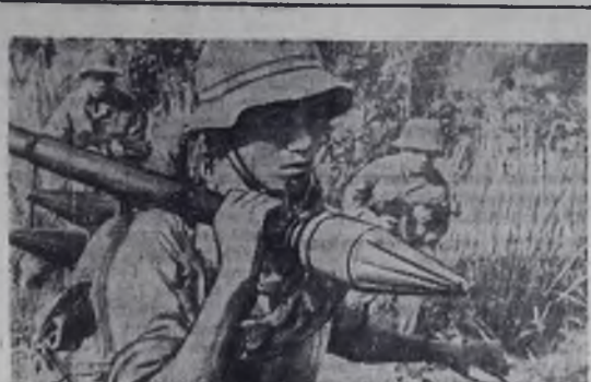
Южный Вьетнам. В провинции Куангчи и Тхыатхьен отряды Народных вооруженных сил освобождения уничтожили недавно роту парашютистов, два взвода и один разведывательный отряд американских войск.

На снимке: воины-патриоты в провинции Куангчи.