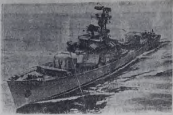
На снимке: Краснознаменный Северный Флот. Противолодочный корабль ведет поиск подводной лодки «противника».

Г. КРОТ, председатель городского комитета ДОСААФ.