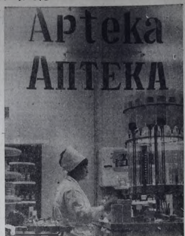
Еще одна аптека появилась в нашем городе.

Еще одна аптека появилась в нашем городе. Расположена она в большом светлом здании в 125-м квартале. Аптека оборудована по последнему слову техники.