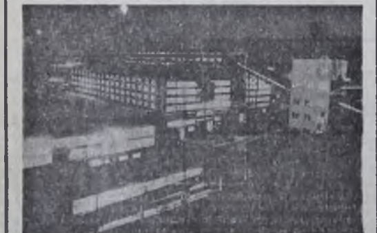
2 стр. Знамя коммунизма