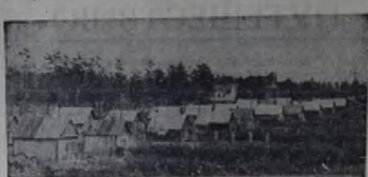
Велика тяга человека к земле, к труду земледельца. И, видно, поэтому горожанин стремится найти себе занятие — обзаводится садовым участком, где он проводит все свое свободное время, выращивает фрукты и овощи. За последние годы в окрестностях Ангарска выросли садоводческие общества, которых насчитывается десятки. «Ангарский садовод», «Зеленая поляна», «Тайга» и еще много разных названий. Есть в нашем городе и такие умельцы, которые своим трудолюбием и настойчивостью сумели вырастить морозоустойчивые сорта яблок и других фруктов. И сейчас никого уже не удивляет, что в Сибири растут яблоки, лимоны и даже апельсины. На снимке: садоводческие участки в Майске.