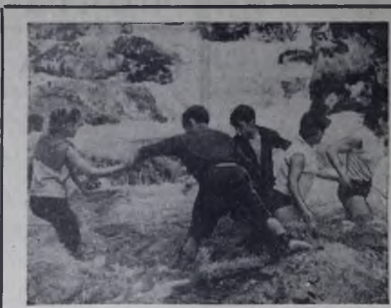
Десятки туристских маршрутов пролегли в этом году в тайге Прибайкалья. Ангарские туристы побывали на Саянах, на пики имени Черского, в Баргузинском заповеднике, на озере Соболином. Им приходилось карабкаться по крутым склонам гор Прибайкалья, переходить бурные потоки, разбивать свои бивуаки в живописнейших местах на берегу Байкала. На снимке нашего читателя Б. Мелентьева вы видите момент перехода туристами таежной реки Снежной.

Адрес и телефоны редакции: пр. Карла Маркса, 41; редактор — 2-42-37, зам. редактора, отдел партийной жизни — 2-21-37, ответственный секретарь, отдел информации и общественная приемная — 9-45-90, отдел промышленности — 2-45-83, отдел культуры, писем и быта и телетайпная — 9-45-92, бухгалтерия, отдел объявлений — 9-45-91, выпускающий и корректоры в типографии — 2-20-68