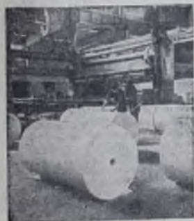
КАРЕЛЬСКАЯ АССР. Быстрыми темпами растет и развивается гирза Умга догора, раскинувшийся на берегу Онежского озера недалеко от столицы республики — Петрозаводска. Только за последние 10 лет мощности Кондопожского целлюлозно-бумажного комбината имени С. М. Кирова возросли в 5,5 раза. Сегодня каждая третья газета в стране печатается на бумаге, выработанной в этом городе.