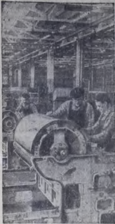
ИВАНОВО. Оборудование, выпускаемое заводом чesальных машин, предназначено для обработки хлопка на текстильных фабриках. За десять лет существования завод увеличил выпуск продукции более чем в 20 раз.

Ленинский зачет завершается всеобщим комсомольским собранием, на котором обобщаются итоги выполнения комсомольцами и молодежью социалистических обязательств в честь XXIV съезда КПСС, определяет контрольные меры по осуществлению новых задач, поставленных партией, заданий новой пятилетки. Всесоюзному комсомольскому собранию должна предшествовать общественно-политическая аттестация каждого комсомольца, которая проводится в канун съезда партии. Собрание принимает решение о сдаче ленинского зачета каждым из его участников. Решение о сдаче ленинского зачета заносится в учетную карточку члена ВЛКСМ. Комсомольцам, отличившимся в ходе зачета, вручается значок ЦК ВЛКСМ «Ленинский зачет».