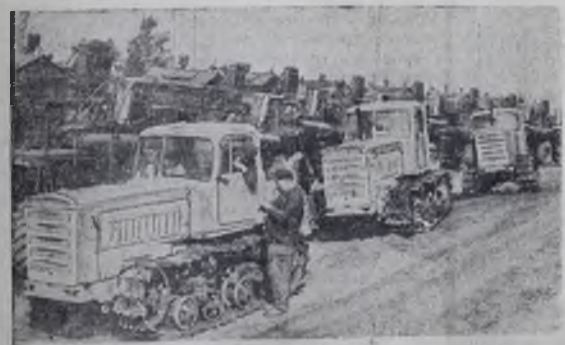
Десятки тракторов, комбайнов и других сельскохозяйственных машин и механизмов отправляет ежедневно Кокчетавская областная база «Казсельхозтехники» в колхозы и совхозы области. Все эти машины сразу же идут на поля.

А пусковой штаб строителей переносится на другой, не менее важный для страны комплекс, — производство синтетических моющих средств.