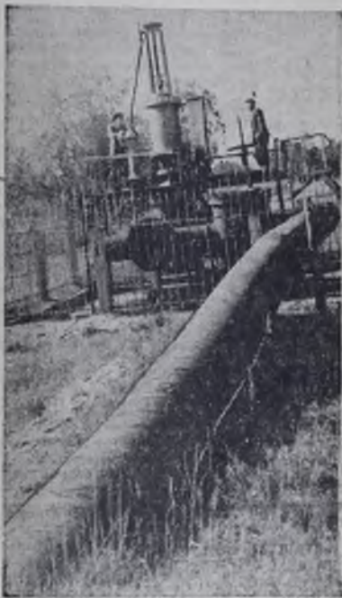
ЗАВТРА — ВСЕСОЮЗНЫЙ ДЕНЬ РАБОТНИКОВ НЕФТЯНОЙ И ГАЗОВОЙ ПРОМЫШЛЕННОСТИ