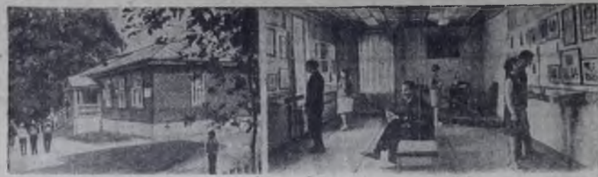
БРЯНСКАЯ ОБЛАСТЬ. В селе Овстуг Жуковского района на родине известного русского поэта Федора Ивановича Гумилева после реставрации вновь открылся музей. Его ежедневно посещают сотни туристов: школьников, студентов, любителей поэзии из многих областей страны. На снимках: внешний вид музея; в одном из его залов.