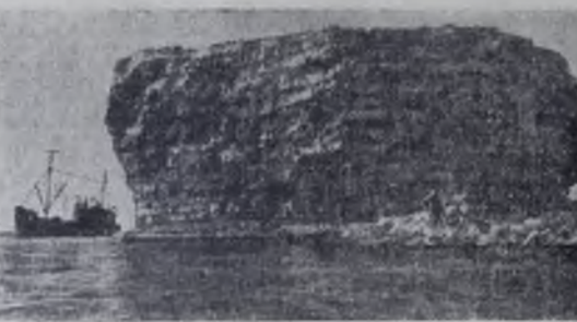
Армянское море привлекает к себе туристов экзотичной берегов, причудливостью многочисленных островов, где единственными обитателями являются птицы. Как гигантский гриб, выскочивший среди моря остров Токмакулы (на снимке). Штормы выбили в его основании удивительные пещеры.