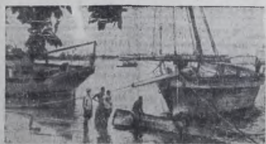
Танзания. Одна из многочисленных бухт Дар-эс-Салама. Отсюда ловцы жемчуга отправляются на промысел.