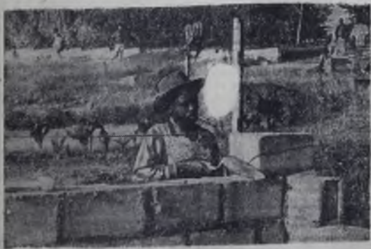
Кигали — столица Респубблики Руанды — одна из самых молодых на африканском континенте. За последние годы в городе построены новые административные здания, гостиница, школы, жилые дома, сооружается большой госпиталь. Профессия каменщика здесь — одна из самых почетных.

И. ХАХОВИЧ, преподаватель Иркутского медицинского института.