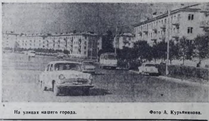
На улицах нашего города.

Письмо было послано в оргстройотдел для расследования и принятия мер. Начальник орс т. Муравьев сообщает, что факты, указанные в письме, подтвердились. Вывоз тары и овощных отходов в настоящее время производится два раза в день — утром и вечером. Директору магазина «Радуга» т. Казанину дано указание строго следить за чистотой территории около павильона.