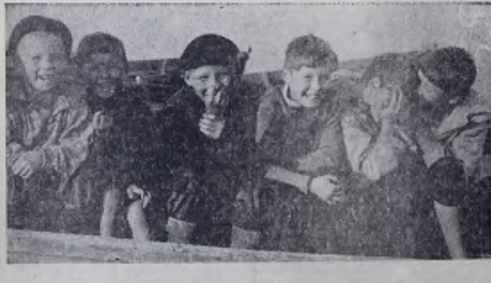
«Объектив-70». Веселые ребята.

еще в нашем городе только-только становится «на ноги», все же среди ангарчан — филателистов можно встретить людей, которые обладают отличными хронологическими и тематическими коллекциями. «Жизни и деятельность В. И. Ленина», «Космос», «Флора и фауна», «Страна родная», «Искусство» — эти и другие тематические коллекции пополняются на встречах филателистов во Дворце культуры. Здесь они обмениваются марками, литературой о филателистике, новостями. Очередная встреча филателистов состоится и завтра, как всегда, в 10 часов. Кроме обычных дел, на повестку завтрашнего дня вынесены вопросы перерегистрации членов Всероссийского общества филателистов, что позволит упорядочить работу городского Совета ВОФ, а также распределение советских и иностранных марок, поступающих в магазины «Кругозор» для филателистов.