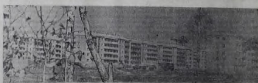
Облик твоего родного города. Территория РМЗ комбината (слева).