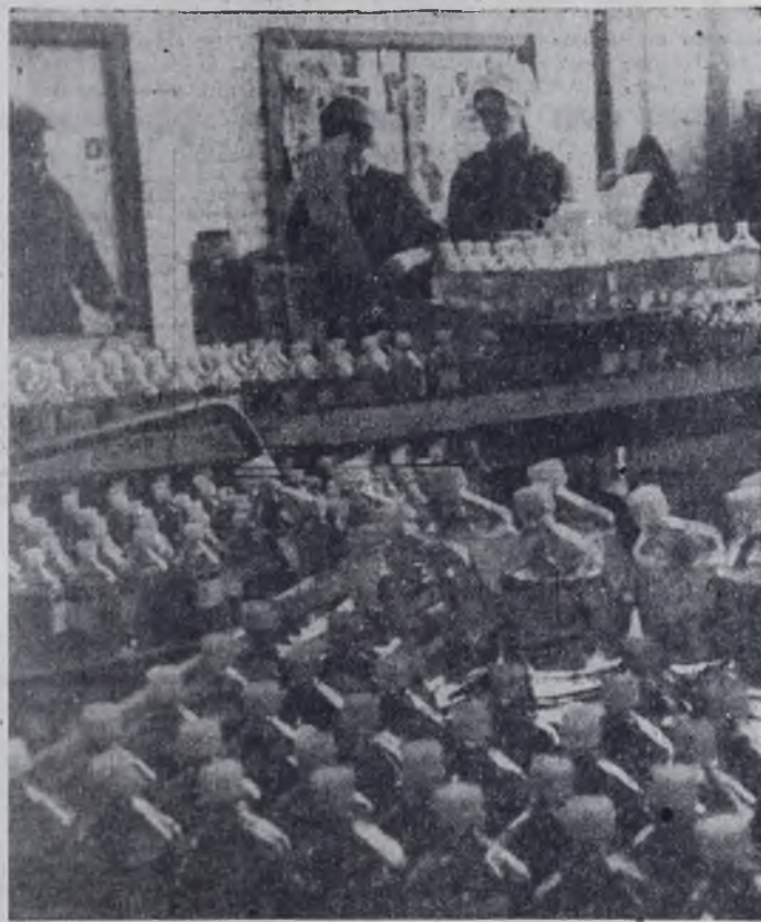
В 1966 году наша газета не раз публиковала фоторепортажи со строительной площадки Ангарского завода химреактивов. Сегодня этот гигант малой химии снабжает своей продукцией предприятия и лаборатории, институты и больницы. В скором будущем он будет выпускать продукции более 800 наименований.

И вот прошло немногим более четырех лет. Что изменилось там, где четыре года назад побывали репортеры? Об этом и в дальнейшем будет рассказывать новая рубрика «Знамени коммунизма» — За строкой в газете».