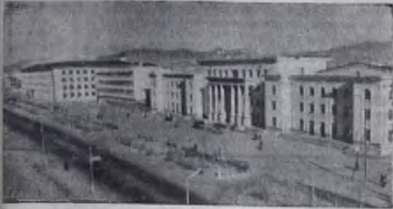
Улан-Батор. Вид на Спортивную улицу.

11 ИЮЛЯ — ДЕНЬ ПОБЕДЫ НАРОДНОЙ РЕВОЛЮЦИИ В МОНГОЛИИ