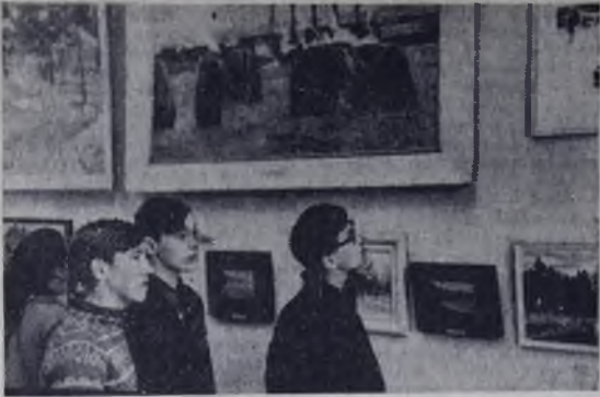
В Ангарском музее.