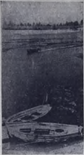
На Кито.

Б ОЛЬШИМ и ярким праздником леткоаглетов был прошедший по традиции в День победы на Московском проспекте девятый по счету финал кросса газеты «Правда». Главный приз Всеюгославского «Кросса миллионов» — за общекомандную победу — вновь в восьмой раз завоевали бегуны сборной РСФСР.