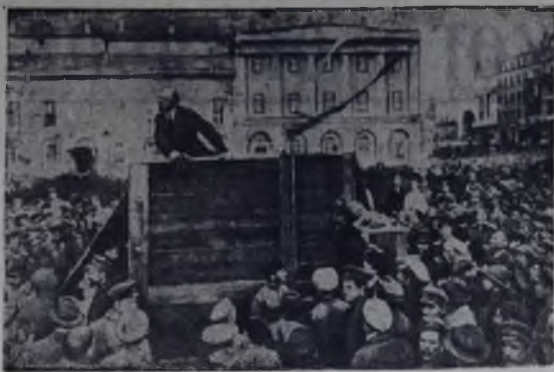
В. И. Ленин выступает на площади Свердлова перед войсками, отправляющимися на фронт. Москва, 5 мая 1920 года.

Для современников, для нас и для будущих поколений запечатлены мгновения жизни Владимира Ильича. Вл. МУТИН.