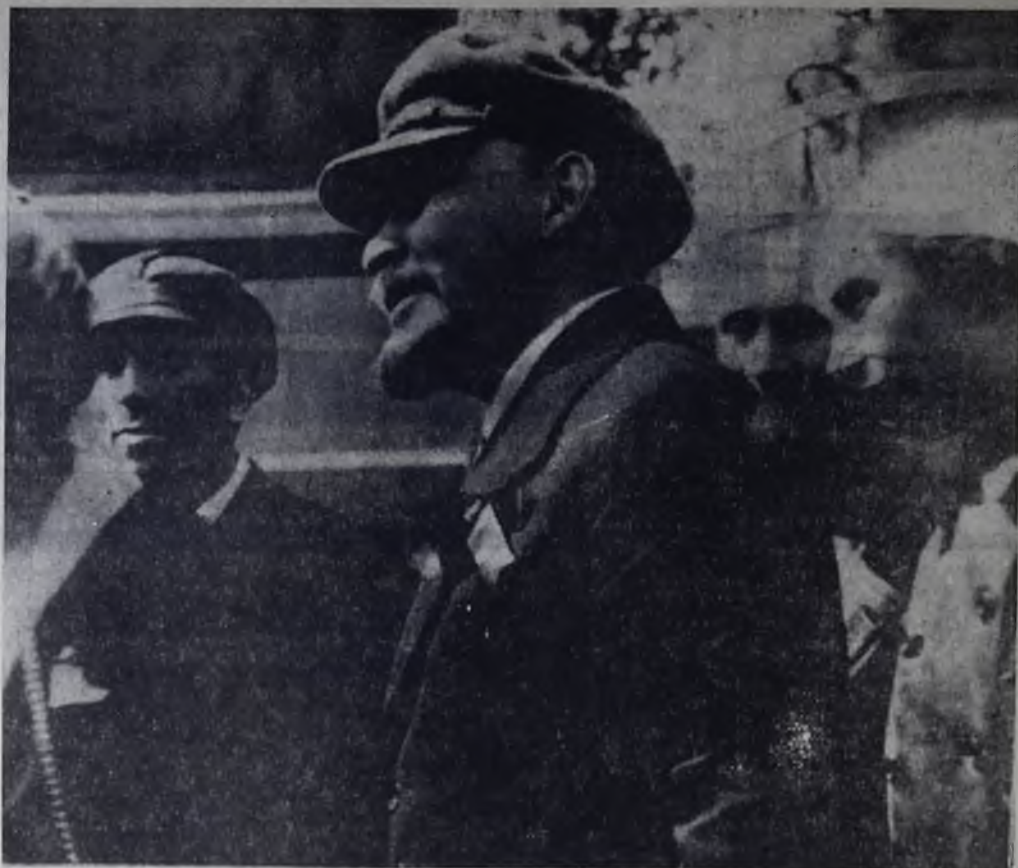
В. И. Ленин во время церемонии закладки памятника «Освобожденный труд». Москва. 1 Мая 1920 года.