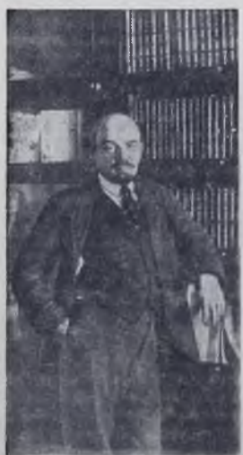
В. И. Ленин у книжного шкафа в своем кабинете в Кремле. Москва, 16 октября 1918 года.

Важнейшей вехой во всей большой работе по распро-