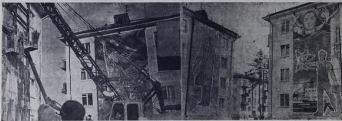
Улицы Социалистическая стала неузнаваемой в эти дни большого праздника. Четыре больших красочных панно из цветной мозаики украсили ее дома. Композиция, выполненная художниками, посвящена началу революционного подвига в России, ставшая основой Советской власти и сегодняшнему дню Родины. Композиция начинается панно, выполненным Вадимом Федоричным, на ко-

У моей тайга. Песня снова вместе с нами новый день встречает. — Выше Ленинское знамя! — Есть, — отвечает, отвечает мой народ, верен, неизменен. — Кто ведет тебя вперед? — Партия! Ленин!