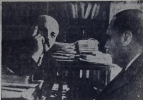
В. И. Ленин в своем кабинете в Кремле беседует с английским писателем Гербертом Уэллсом. Москва, октябрь 1920 года.