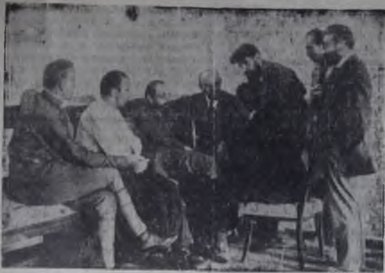
В. И. Ленин в Кремле беседует с итальянскими делегатами VII Конгресса Коминтерна. Москва, июль-август 1920 года.