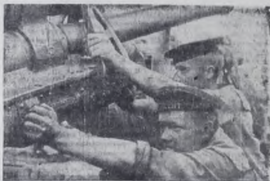
Новороссийск. Июнь 1942 года. Погрузка орудий на лидер «Ташкент», идущий в осажденный Севастополь.

Неудачно сложилась обстановка под Харьковом, где гитлеровскому командованию удалось не только остановить частное наступление наших войск, предпринятое с целью окружения и уничтожения харьковской группировки, но и нанести сильный контрудар, за которым последовало наступление с целью прорыва через излучину Дона к Волге и перехвата важнейшей водной артерии в ее среднем течении с тем, чтобы в последующем, прикрываясь с севера по рубежу Дона, начать наступление на Кавказ. Начались невиданные по своему ожесточению и размаху бои, финалом которых стала Сталинградская битва.