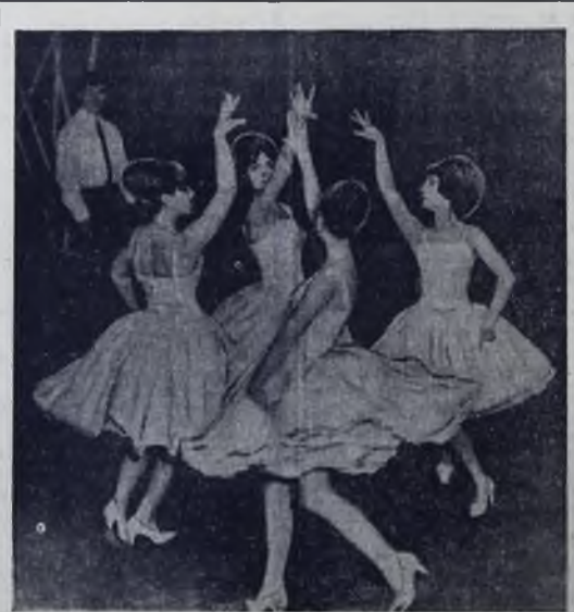
Ансамбль балетного танца при Дворце культуры нефтехимиков давно завоевал популярность. Каждый, кто хочет научиться танцевать современно, может прийти сюда.

Адрес и телефоны редакции: пр. Карла Маркса, 41; редактор — 2-42-37, зам. редактора, отделы партийной жизни, культуры — 2-21-37, ответственный секретарь и общественная приемная — 9-45-90, отдел промышленности — 2-45-83, отдел писем, информации и телетайпная — 9-45-92, бухгалтерия, отдел объявлений — 9-45-91, выпускающий и корректоры в типографии — 2-20-63