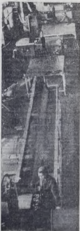
Завод железобетонных изделий № 1 — старейшее предприятие стройиндустрии Ангарска. Его продукция поступает на многие стройки нашего города и области. За последние годы на заводе проведена большая работа по реконструкции старых мощностей. На снимке вы видите цех арматурных изделий ЭЖИ № 1.

Сегодня на городском слете бригад и ударников коммунистического труда будет немало и наших делегатов. Им будет что рассказать. За 10 лет движение за коммунистический труд стало нормой нашей жизни. Л. КОЗЛОВ, председатель заводского комитета ТЭЦ-1.