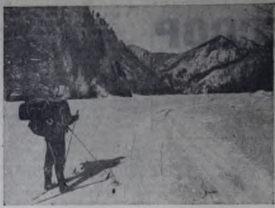
В верховьях Китая.

«ОКТАБРЬ» — 28 февраля, 1 марта — Рождество свободной. 10, 12, 14, 16, 18, 20, 21-40 (удлиненный) — Размышления о любви (английский). 2 марта —