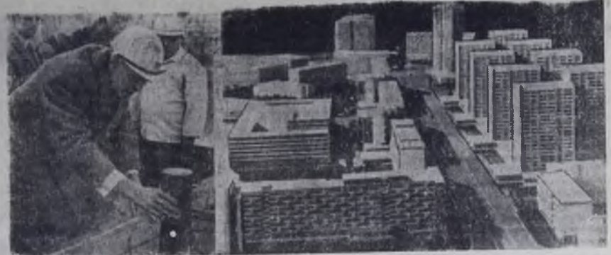
Недавно обербургомистр Берлина Герберт Фехнер (на левом снимке) принял участие в торжественной церемонии закладки фундамента 22-этажного жилого дома. Так было положено начало претворению в жизнь проекта застройки еще одного района столицы ГДР. Макет (на правом снимке) показывает, как будет выглядеть в недалеком будущем эта часть города между Фридрихсфелде и Шпиттельмаркт.