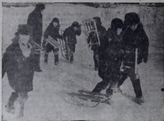
В субботний день.

Последними были заплывы стилем «дельфин» на 50 и 100 метров, требующие большой физической закалки и длительной, упор-