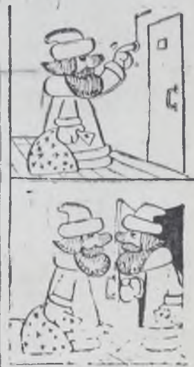
(Продолжение. Начало на 2 стр.)

ные за подвиги божьими орденами. А Дед Мороз образца 1961 года держал в руках шлем первого в мире советского человека, совершившего космический рейс.