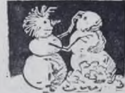
(Окончание. Начало на 2 стр.)

раз под стать настроению — праздничному, новгородскому. А почему бы и не пошутить, когда принимаешь для предложения отличные дела, в замечательной стране, где вершинами этих дел будут миллионы отяжлых людей.