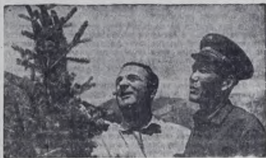
Забота о лесах, о правильном пользовании ими — одна из насущных государственных задач.

На двадцати семи тысячах гектаров раскинулись владения Фрунзенского механизированного лесхоза.