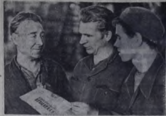
К 100-ЛЕТИЮ В. И. ЛЕНИНА