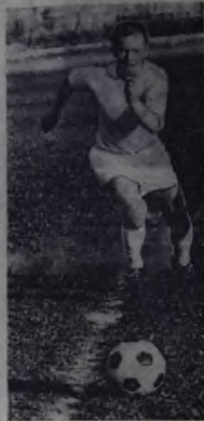
Он еще молод, как и вся команда «Старт». А значит, и у него, и у команды большое будущее. И нам, болельщикам, надо верить в то, что в Ангарске будет по-настоящему большой футбол. К. ВАСИЛЬЕВ, Фото И. АМОСОВА.