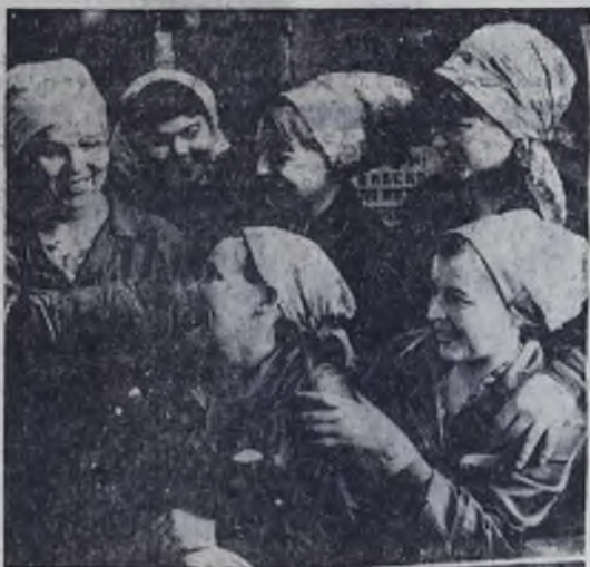
Успешно выполняют социалистические обязательства, взятые в честь 100-летия со дня рождения В. И. Ленина, труженицы Ангарского электромеханического завода.

Среди сданных в прошлом году объектов — 14 магазинов, 7 столовых, 5 школ, 9 детских учреждений, музыкальная школа и много других. Немаловажно, что 80 процентов объектов культурно-бытового назначения и жилья приняты комиссиями с оценками «хорошо» и «отлично».