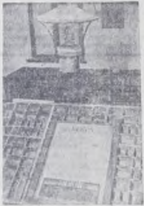
Лейпциг. Наборная касса и копия первой полосы первого номера «Искры» в помещении бывшей типографии, где печаталась газета.

высокомерно, требовал привилегированного положения в редакции. Это угрожало срывом издания газеты. С большим трудом удалось достигнуть соглашения. Решили издавать газету в Германии. Главное ядро редакции обособилось в Мюнхене. Сюда прибыл и Ленин.