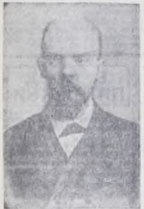
В. И. Ленин, руководитель «Искры».