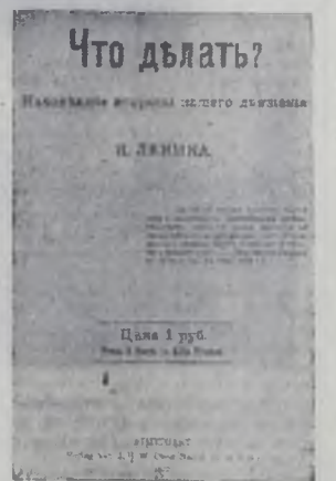
Обложка первого издания книги В. И. Ленина «Что делать?»

Ленинский план построения марксистской партии одержал победу. Созданная им «Искра» стала центром объединения, сплочения и воспитания социал-демократических организаций.