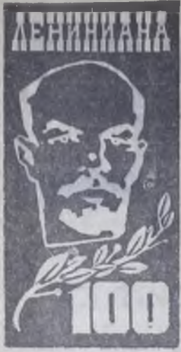
ВЫПУСК 4 (16)

После окончания ссылки В. И. Ленин объехал Петербург, Москву, Ригу, Уфу и другие города. Там он создает опорные пункты для будущей общерусской нелегальной газеты, устанавливает прочные связи с марксистами. Из-за невозможности издавать газету в царской России В. И. Ленин в июле 1900 года выехал в Швейцарию, где жил Г. В. Плеханов и другие члены группы «Освобождение труда», полагая, что они должны принять участие в создании