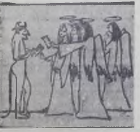
К вопросу об автографах.

Двенадцать баллов. Валы-кувалды наш сейнер рушат. Дают сполна. Наверно, свадьба у бога моря, у Нептуна. Морзянка гложет в распадке ветра, по мы сегодня не крикнем «SOS». Мы знаем штормы. Мы — люди века. И век, он тоже — простой матрос. Двенадцать баллов его трепало. Гудели айны — его шторма. И время раненно «SOS» кричала, качая гюрьмы и терема. Двенадцать баллов. Нас море крутит, гоня и руша за валом вал Двенадцать баллов! Но крепнут люди, держ в ладонях тугой штурвал. Владимир СМИРНОВ, художник.