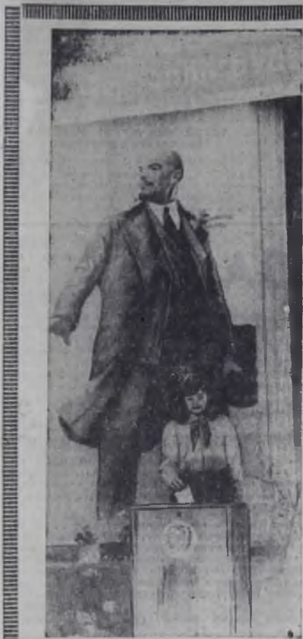
— 1 —

А КТИВНОСТЬ избирателей и ход событий выборной кампании, как всегда, во многом зависят от агитаторов. На избирательном участке № 47 (дома № 5-13 квартала 82) уже к 9 часам утра проголосовало более трети избирателей. А в семнадцатом часу избиратели участка почти полностью проголо-