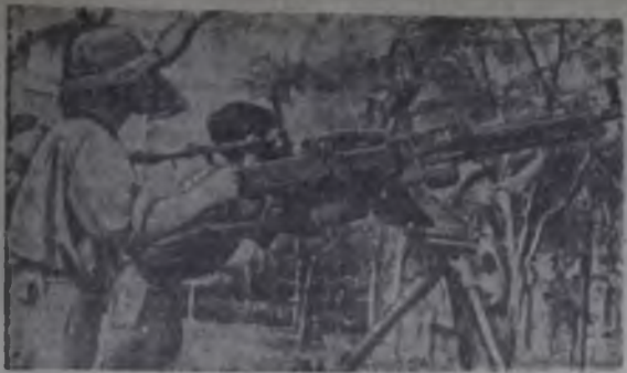
ЮЖНЫЙ ВЬЕТНАМ. Нарастающие наступательные действия, части Народных вооруженных сил Освобождения повсеместно наносят тяжелые удары по американским агрессорам и сайгонским марionетным войскам. На снимке: бойцы НВСО ведут огонь по американским вертолетам.

ПОЛОШАДЬ УХУРУ, на которой находится памятник Независимости — одна из самых красивых в столице Танзании Дар-эс-Саламе. Неповторимо огромен по площади, там, где начинается африканский квартал города, расположено помещение Женской лиги партии Африканский национальный союз Танзании. Каждый год женщины со всех уголков страны собираются здесь на торжественное заседание, чтобы отметить Международный женский день 8 Марта.