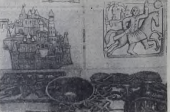
Московский завод цветного литья начал выпускать новую продукцию — русские сувениры. Среди них оригинальные литые подсвечники, настенные панно, пепельницы и другие сувениры, сделанные по мотивам русской старины московскими художниками. На снимке: сувениры, выпускаемые заводом.

и в центральном фойе, в классных комнатах. Вскоре попугайчики, оставив свои трапезники, на которых они могут раскачиваться без усталости, принялись за завтрак. Среди них появились маленькая пташка. — Уж не воробей ли это? — спросил я. — Нет, это чечетка, — ответили мне, — пересмешка, и мы ее выпустим на волю. По веселому щебетанию чечетки можно было судить, что обитательница полярной тундры неплохо ладит с завсегдатаями южных широт. Когда почти все питомцы интерната были накормлены, кто-то из ребят спросил: «А где Яшка?» — Опять, наверное, спрятался, — сказала Света и пошла на поиски. Вернувшись, держа в лапах ежика. Это и был Яшка. Ему подали персональный завтрак — Яшка всеобщий любимец и баловень. Юннаты не только собирают животных, они ведут за ними тщательные наблюдения, изучают книги, в которых рассказывается о их жизни. Красочные иллюстрации зверей и птиц, вывешенные на стендах, тщательно подобраны и снабжены пояснительным текстом. Это также дело рук юных любителей природы. А. СЕРЕДКИН, студент НГУ.