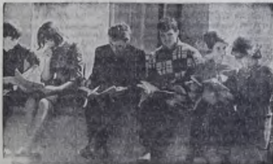
...читься, учиться и учиться...

В области работает 34 научно-исследовательских и проектных института.