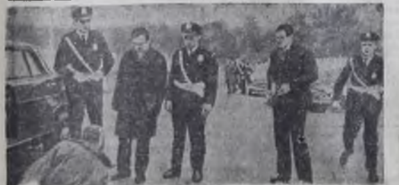
«Мертвый сезон» — это рассказ о советском разведчике, которому удалось разоблачить немецких военных преступников, тайно работающих в одной из западных стран над созданием нового химического оружия. Картина «Мертвый сезон» создана на студии «Ленфильм».

Все это — лишь краткий ввод в богатство издания «Советского художника» будущего года, число которых достигнет полутора тысяч Л. ОЛЬХОВАЯ.