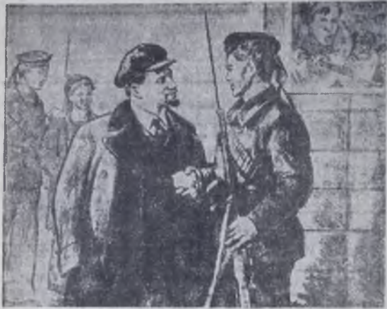
«Великое наследство Ленина, в том числе и в области военной организации, стратегий и тактики. Ленин был величайшим полководцем в истории войн трудящихся масс за свое освобождение от угнетателей, он положил начало советской регулярной армии, основанной на принципах современной науки и техники.»