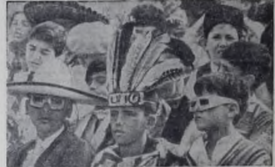
МЕХИКО. На снимке: зрители на трибунах стадиона.

(Спец. корр. ТАСС). набрали 286,4 балла, а сборная СССР — на 1,25 балла меньше. В олимпийском бассейне пловцы разгромили еще три золотые медали. С подавляющим преимуществом финальный заплыв на 100 метров на спине выиграл юный спортсмен из ГДР Р. Матте. Он установил новый олимпийский рекорд — 58,7 секунды. На ди-