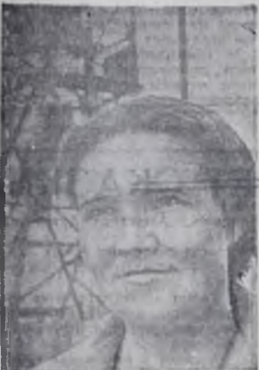
ных изделий Антонина Семенова.