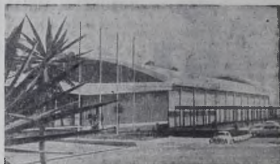
На снимке: Мехико. Зад легкой атлетики в Олимпийском спортивном центре.