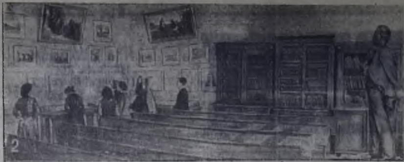
Н. К. КРУПСКАЯ