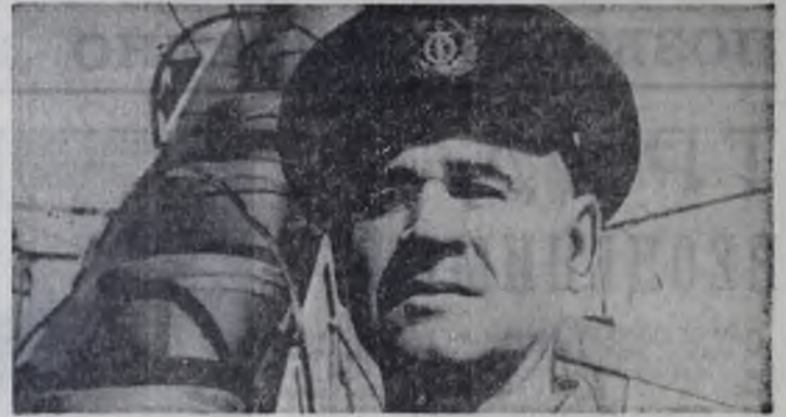
— ТВОЯ ПРОФЕССИЯ