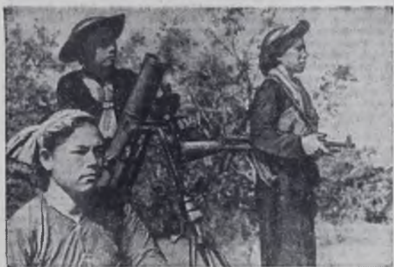
Отважные патриоты Южного Вьетнама прекрасно владеют оружием. В любой момент готовы они поразить противника.

АМЕРИКАНЦЫ РАЗОЧАРОВАНЫ ВАШИНГТОН. (ТАСС). «Американцы недовольны кандидатурой на президентских выборах 1968 года», — сообщает служба Луиса Харриса — организация по опросу общественного мнения. Сотрудники этой организации опросили 1322 американцев, представляющих самые широкие слои общественности. На вопрос: кого каждый из них хотел бы видеть на посту президента Соединенных Штатов, 57 процентов опрошенных не назвали ни одного из трех кандидатов в президенты — Никсона от республиканцев, Хэмфри от демократов и Уоллеса от так называемой американской независимой партии. 46 процентов опрошенных ответили, что они разочарованы выбором, с которым им придется столкнуться на избирательных участках в ноябре этого года.