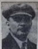
Н. К. КРУПСКАЯ

ВЛАДИМИР ИЛЬИЧ прислал в Питер осенью 1893 года, но я познакомилась с ним не сразу. Слышала я от товарищей, что с Волги приехал какой-то очень знающий марксист, затем мне принесли тетрадку «О рынках», порядком-таки зачитанную. В тетрадке были изложены взгляды,