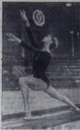
Член олимпийской сборной СССР по спортивной гимнастике Людмила Турисева.