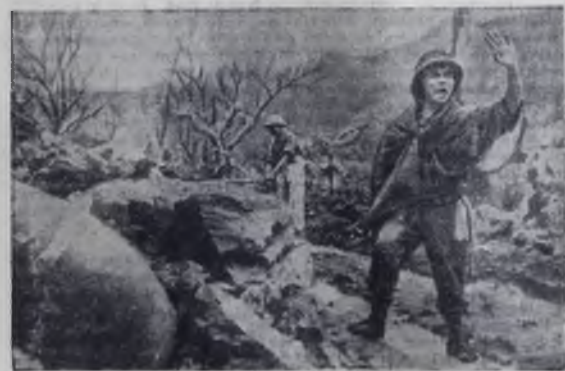
В Москве открылась фотовыставка «Вьетнам в борьбе и труде». На выставке представлено около 120 фотодокументов. Экспонат выставки — «Внимание! Бомбы замедленного действия».