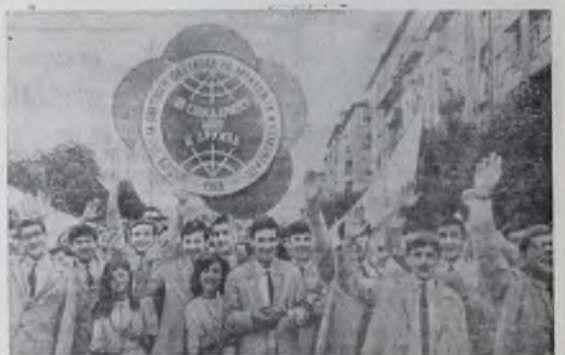
На снимке: участники фестиваля во время торжественного шествия по улицам столицы Болгарии.

НА IX ВСЕМИРНОМ ФЕСТИВАЛЕ МОЛОДЕЖИ И СТУДЕНТОВ В СОФИИ