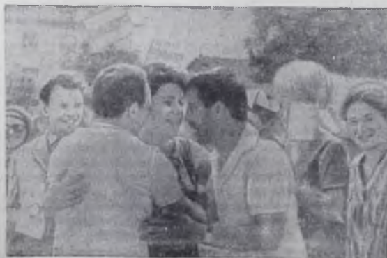
На снимке: советская делегация в столице Болгарии. Встреча давних друзей.

Виктор ДМИТРИЕВ, специальный корреспондент АПН.