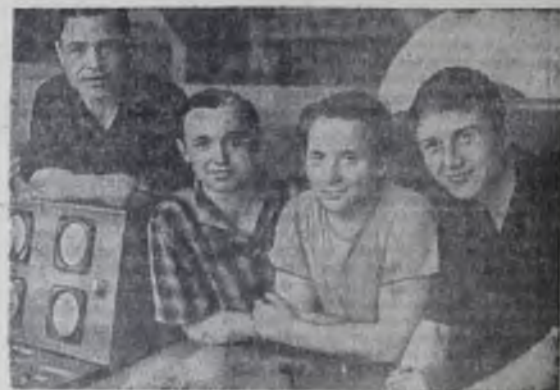
КАРЕЛЬСКАЯ АССР. Замечательным трудовым подарком ознаменовался поступление во вторую половину пятилетия коллектива Компожского целлюлозно-бумажного комбината. При обязательстве дать стране в третьем году пятилетия 5 тысяч тонн сверхплановой бумаги за шесть месяцев 1965 года он уже выработал дополнительно к заданию 3374 тонны газетной бумаги.