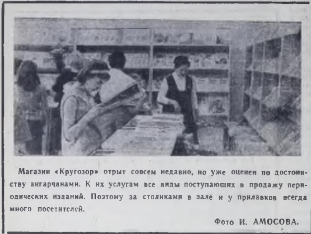
Магазин «Кругозор» открыт совсем недавно, но уже оценен по достоинству ангарчанами. К их услугам все виды поступающих в продажу периодических изданий. Поэтому за столиками в зале и у прилавков всегда много посетителей.