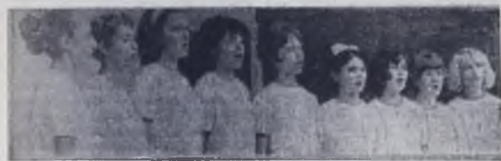
Вокальный ансамбль ДК «Энергетик» очень молод. Ему нет еще года. Но артисты этого коллектива участвовали в заключительном смотре фестиваля.