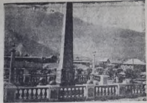
СЛЮДИНКА. Обелая на могиле павших борцов за власть Советов в Сибирь.