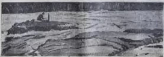
А. Шаталов. «ПАДУНСКИЕ ПОРОГИ».