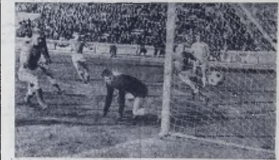
На снимке: есть гол!

22 мая в салоне второго этажа центрального универмага было необычнолюдно. Внимание горожан привлекала выставка хлопчатобумажных тканей. Многие ангарчанам в этот день пришлось по душе народные льняные белорусские ткани, венгерские и отечественные ситчи. Почти каждый покупатель ушел из магазина с желанной покупкой.