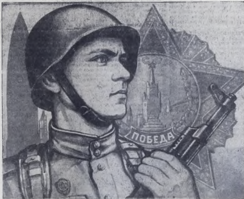
Плакат художника А. Георгиева.