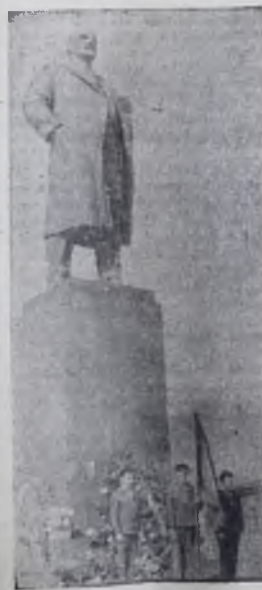
На снимках: слева — почетный караул у памятника В. И. Ленину, вверху справа — учащиеся школы-интерната № 2.

22 апреля, утро. Колыхнутся на ветру алые стяги, звучат барабаны, гремят оркестры. По улицам всех городов нашей страны в этот день проходят колонны пионеров и школьников. Они идут к памятнику Владимиру Ильичу Ленину, чтобы до земли поклониться человеку, с именем которого связана жизнь каждого из нас.