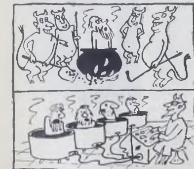
Модернизация производства. Рис. В. Дмитриева.

шествования здесь было посажено 123 дерева, привезли из которых 0,02. Торжественное закрытие парка состоится в честь 0,02 прижившихся деревьев.