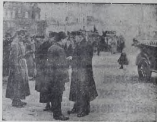
В. И. Ленин на Красной площади беседует с секретарем МК РКП(б) В. М. Загорским во время Первоймайской демонстрации. Москва. 1 Мая 1919 г. Фото АПН.

Анатолий РУСАК, сотрудник Института истории Академии наук Украинской ССР. (АПН).