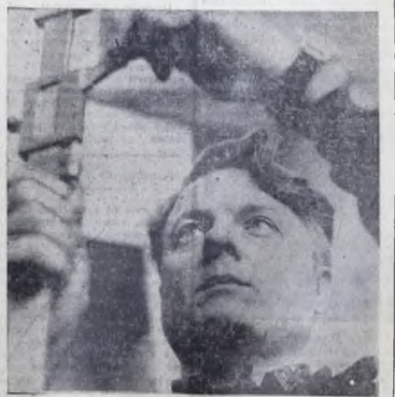
Большую и интересную работу ведет коллектив центральной заводской лаборатории ремонтно-механического завода Ангарского нефтехимического комбината. Его основная работа заключается в том, чтобы следить за «здоровьем» оборудования в технологических цехах.

Корреспондент газеты «Нью-Йорк таймс» пишет, что бойницы в госпитали Южного Вьетнама переполнены жертвами бомбардировок. В приведенном газетой сообщении указывается, что город Гуа превращен в руины, почти 3/4 его зданий разрушено.